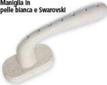
Maniglia in pelle bianca e Swarovski