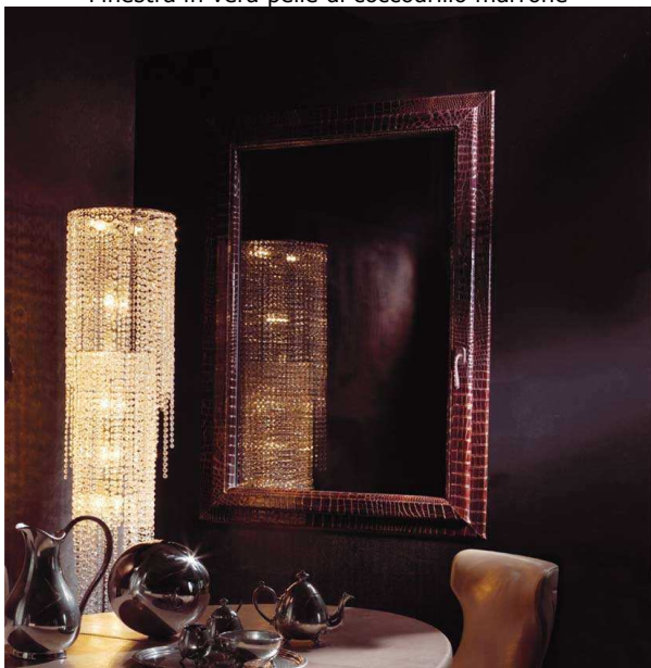
Finestra in vera pelle di cocodrillo marrone