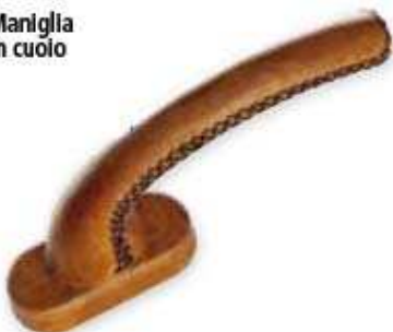
Maniglia in cuoio