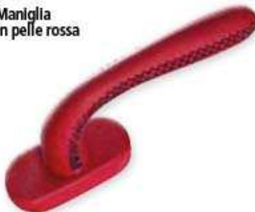
Maniglia in pelle rossa