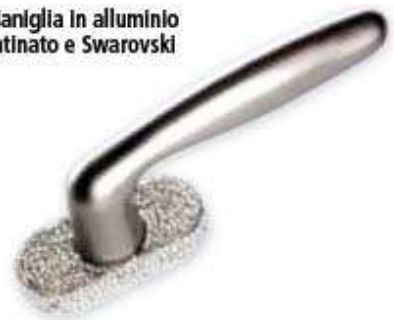
Maniglia in alluminio satinato e Swarovski