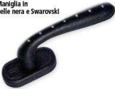
Maniglia in pelle nera e Swarovski