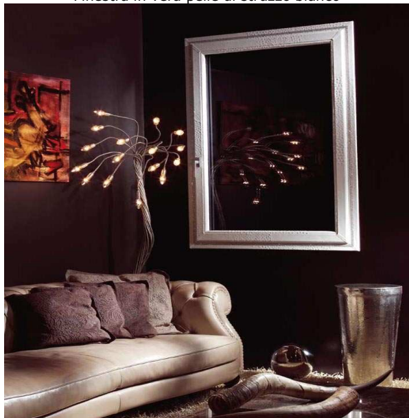
Finestra in vera pelle di struzzo bianco