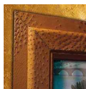
FENÊTRE EN VRAIE PEAU D'AUTRUCHE OCRE