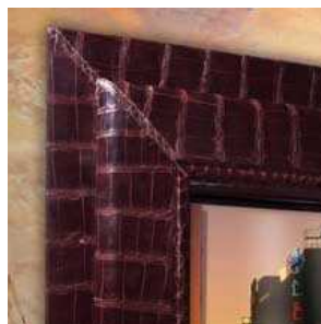
FENÊTRE EN VRAIE PEAU DE CROCODILE MARRON