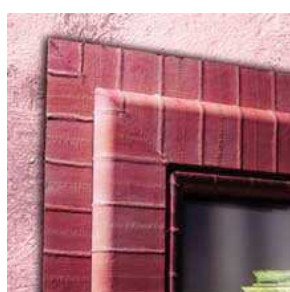
FENÊTRE EN VRAIE PEAU D'ANGUILLE ROSE