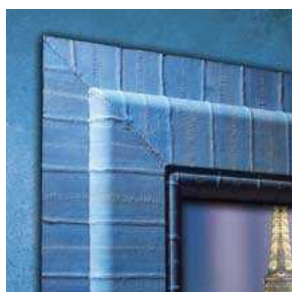
FENÊTRE EN VRAIE PEAU D'ANGUILLE BLEU