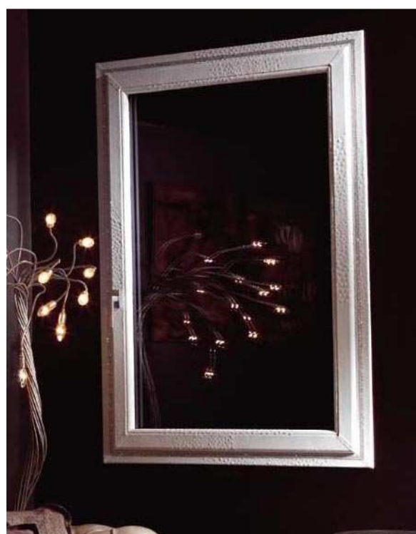
FENÊTRE EN VRAIE PEAU D'AUTRUCHE BLANC